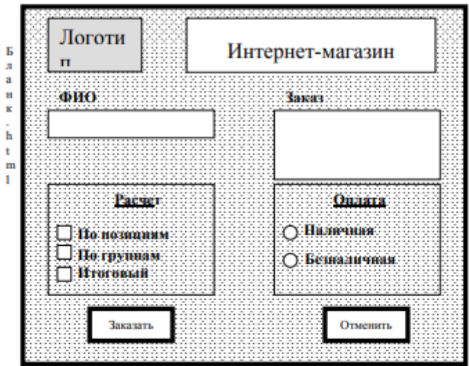
Рис. 2 Структура страницы «Гостевая»