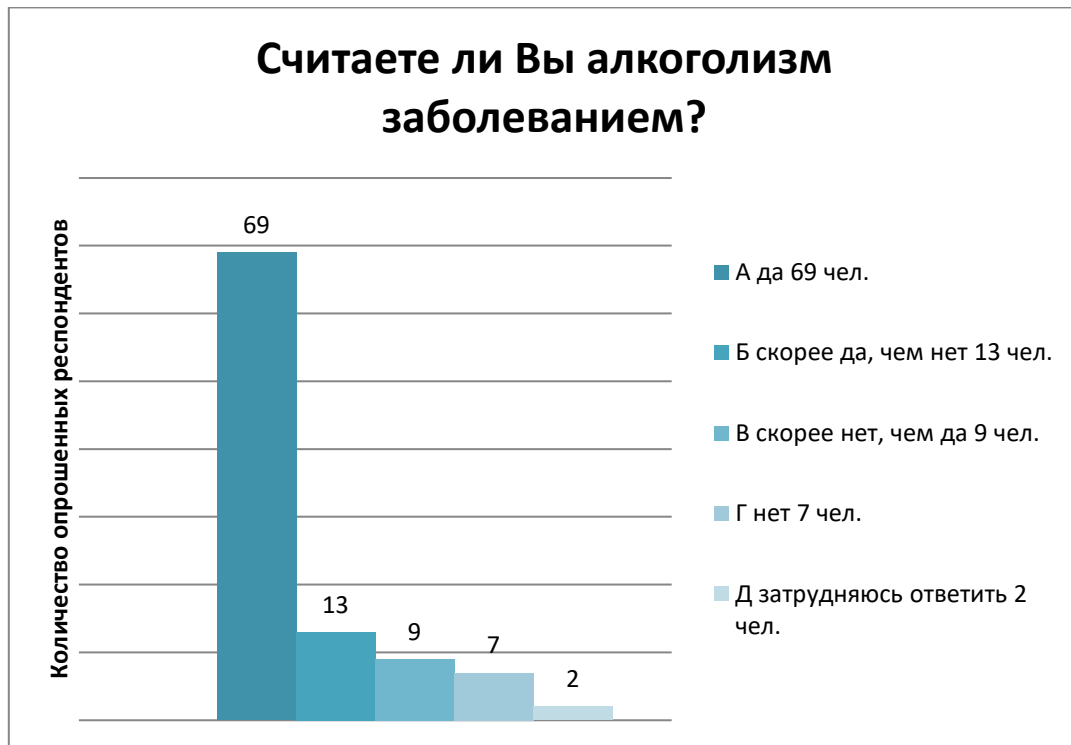
Рис. 1. Распределение ответов респондентов на вопрос «Считаете ли вы алкоголизм заболеванием?».